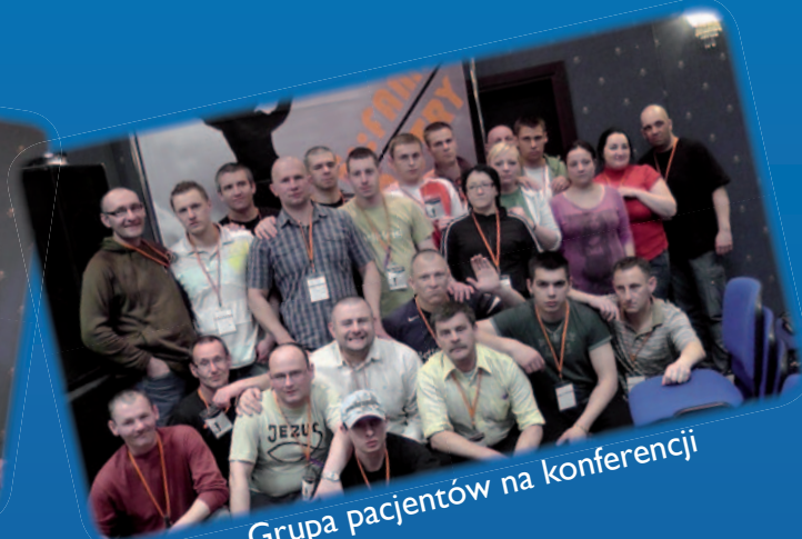
Grupa pacjentów na konferencji